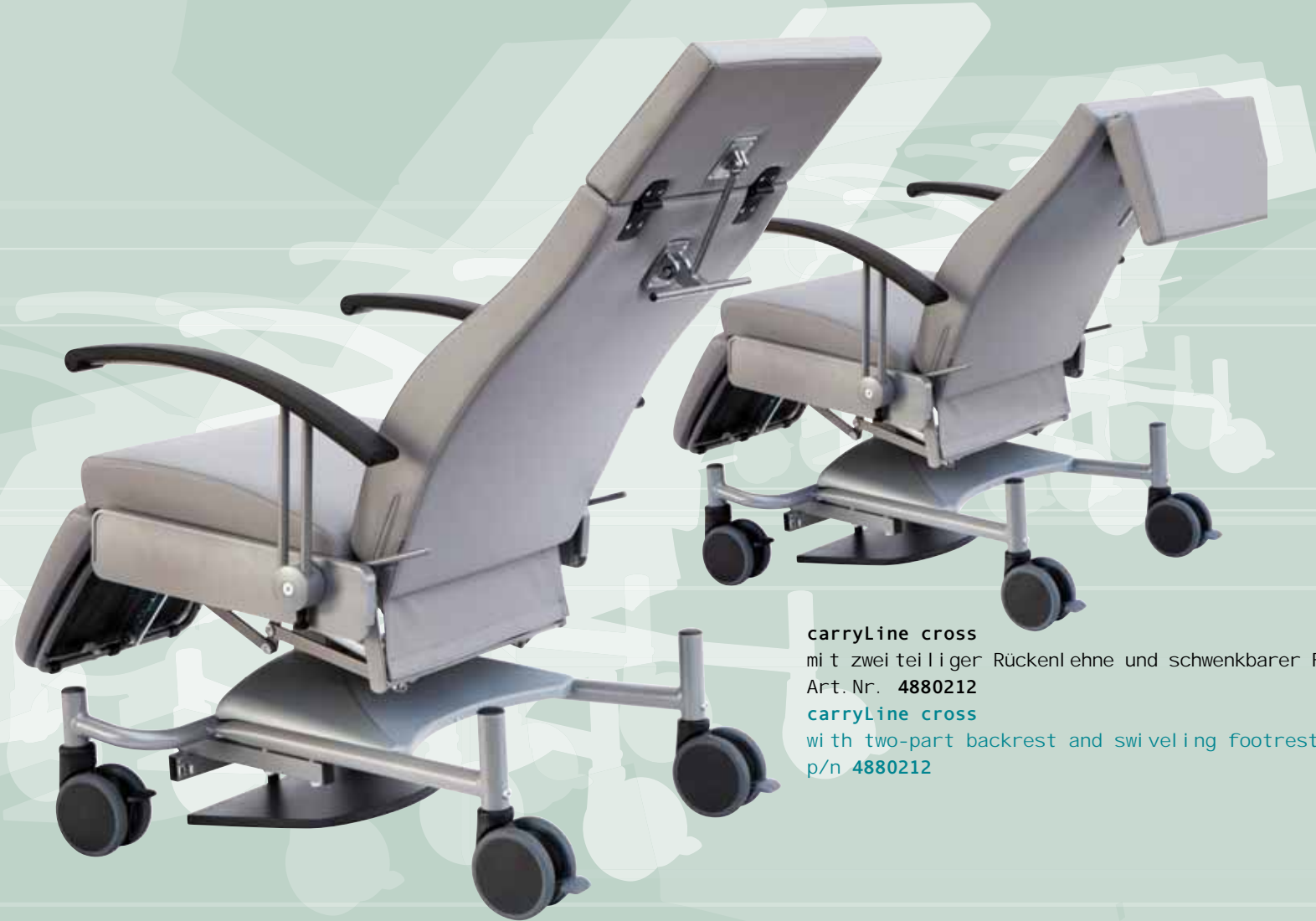
carryLine cross mit zweiteiliger Rückenlehne und schwenkbarer Fußstütze Art. Nr. 4880212 carryLine cross with two-part backrest and swiveling footrest p/n 4880212

Das Fahrwerk der carryLine cross ist auf engem Raum sehr beweglich. Die beiden vorderen Doppellaufrollen lassen sich in Fahrtrichtung feststellen und stellen so den Geradeauslauf sicher. Alle 4 Rollen haben einen Durchmesser von 125 mm und einen Totalfeststeller. Die Sitz-/Liegehöhe beträgt 51 cm. Die Armlenken lassen sich nach hinten abschwenken und ermöglichen einen seitlichen Ein- und Ausstieg in/aus dem Stuhl.