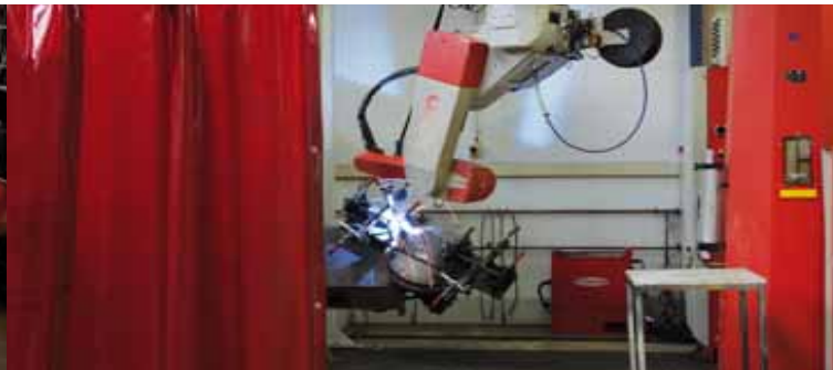
CNC-Schweißen CNC welding