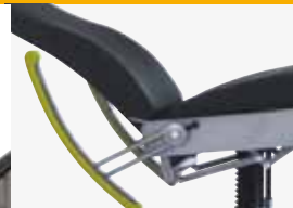
armrests til table