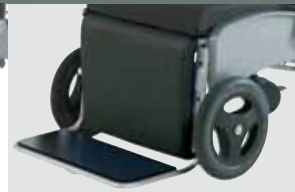
footrest adjustabl e, detachabl e mobil/mobil hv