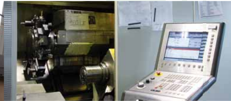
CNC-Drehen CNC lathing