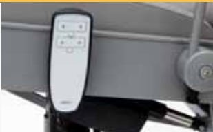
adjustment electrical ly