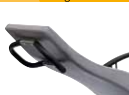
backrest one-part, hand le