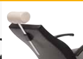
short, adjustabl e, detachabl e