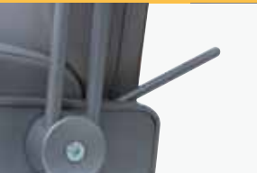
back- and legrest manual ly