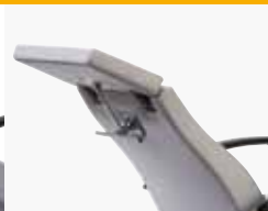
two-part, til table