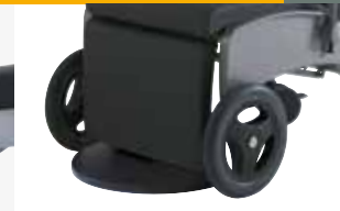
footrest swi vabl e